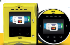
2024 : Nouveau logo !